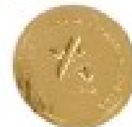
Chief Executive Officer/Directrice générale